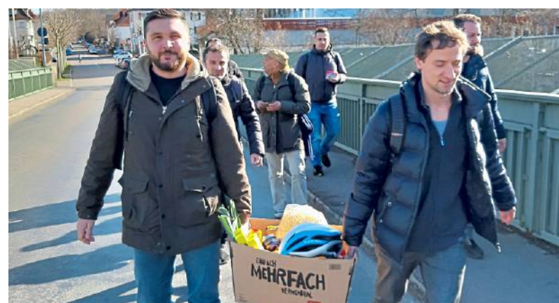
Nur einen Fußmarsch von der Schule entfernt liegt der Tafelladen.

Dass sich der Gegensatz von Überfluss und Bedürftigkeit quer durch unsere Gesellschaft zieht, haben wir im Unterricht behandelt. Hier bekommt diese Tatsache ein Gesicht: Die bundesweit 940 Tafelläden nehmen das, was andere wegwerfen, und darauf sind eine Menge bedürftiger Menschen angewiesen. Laut Armuts-